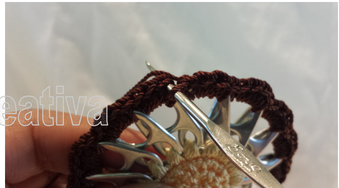
18. Close with a slip stitch 18. Cerrar con punto deslizado