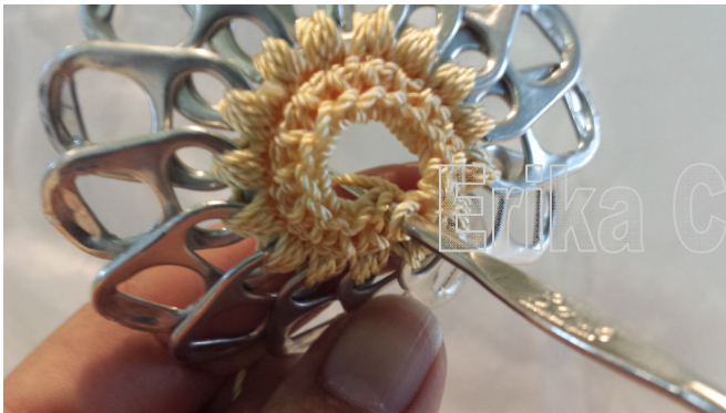
11. Close round with a slip stitch 11. Cerrar vuelta con punto deslizado