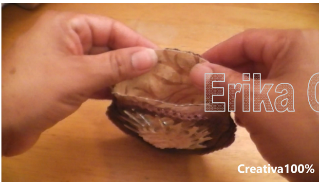
29. Place the lining inside the purse and stitch together around the top edges. 29. Colocar el forro y coser con aguja e hilo