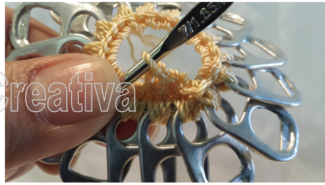
10. Decrease 1 stitch, SC, decrease 1, SC until finish 10. Hacer medio punto saltando una puntada hasta terminar