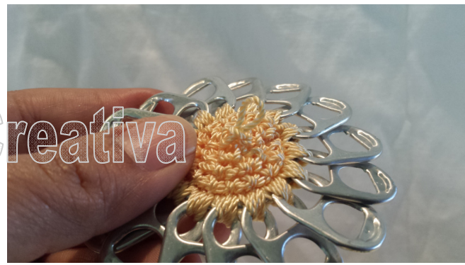
14. We finish with a loop like this 14. Terminamos con una lazada así