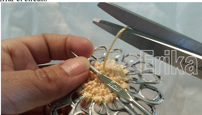
15. Turn the piece, pull the loop through and cut the thread 15. Voltar la pieza, jalar la lazada y cortar el hilo