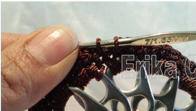
21. SL ST to close round. Place the piece into the purse frame and mark on each side where the ends of the frame to. 21. Cerrar con punto deslizado. Poner una boquilla para marcar los puntos de inicio y final