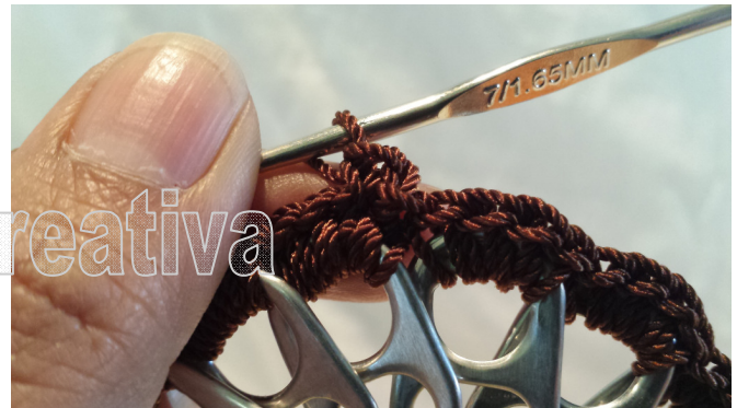
20. One more SC round 20. Una vuelta mas de MP