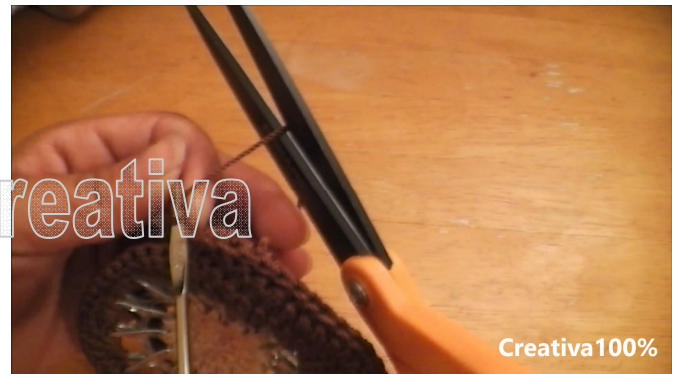
26. Cut the cord 26. Cortar el hilo