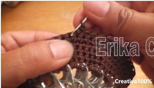
25. Join the 2 pieces with SC inside out 25. Unir las 2 piezas con MP por el lado del revers