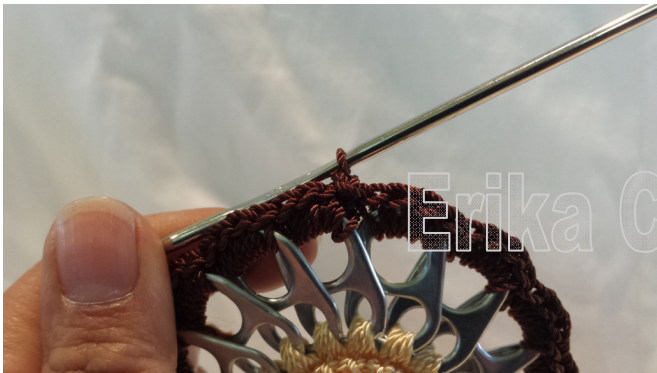
19. Chain one 19. Subir con una cadena