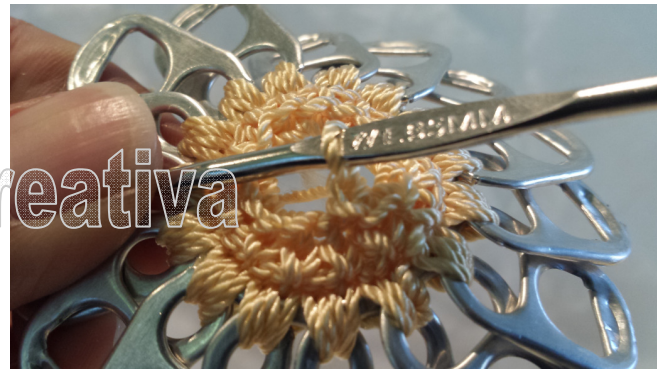
12. Ch 1. Repeat steps of round #1 12. Subir con una cadena y repetir los pasos de la 1ra vuelta.