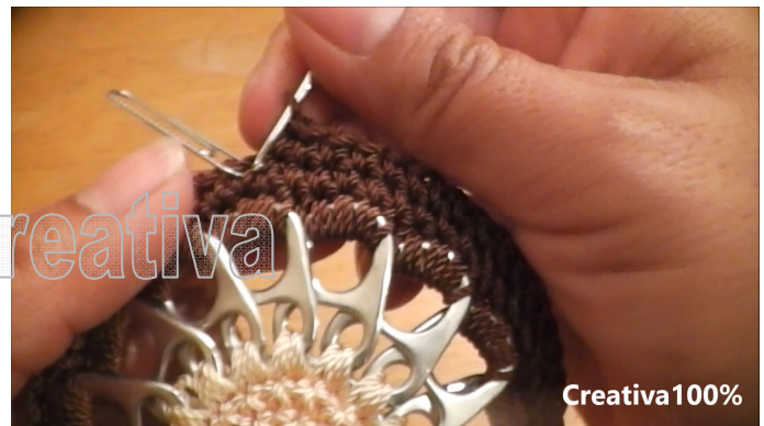
22. I made about 4 SC rounds 22. Hice 4 vueltas de MP