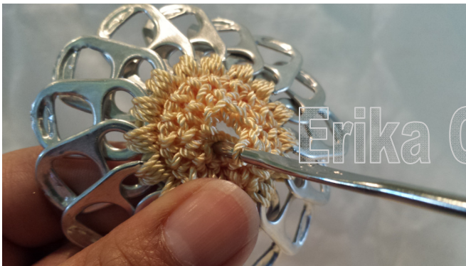
13. Close with a slip stitch and another slip stitch to close circle 13. Cerrar con punto deslizado y hacer otro punto deslizado para cerrar el círculo