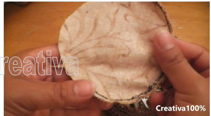
28. Line the purse 28. Colocar el forro