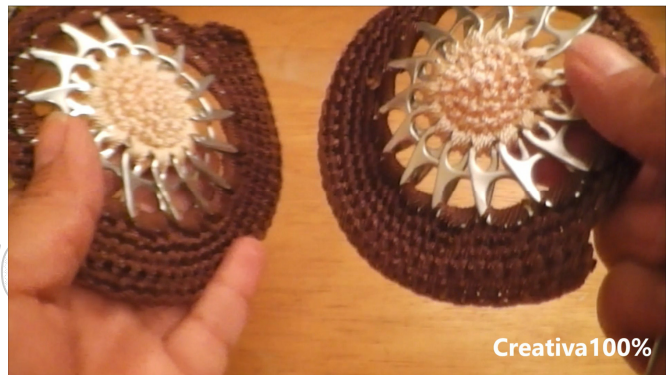
24. We need 2 pieces 24. Se necesitan 2 piezas