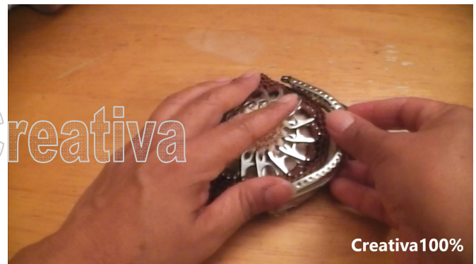
30. Stitch the purse into the frame 30. Agregar la boquilla cosiendola con aguja e hilo

Facebook: https://www.facebook.com/ErikaCreativa/