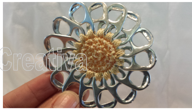
16. Center refill ready 16. El relleno del centro está listo