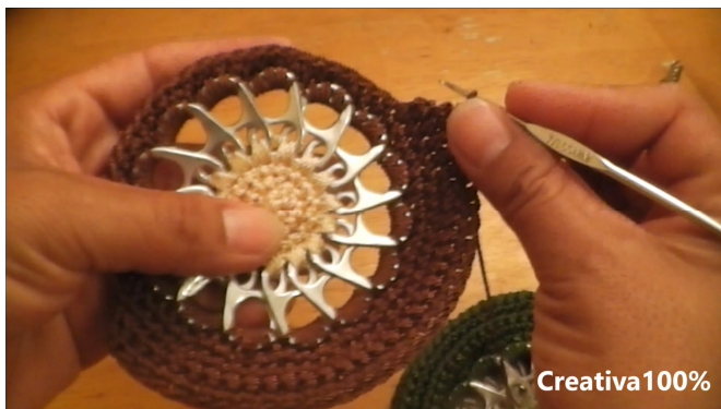
23. Cut the cord and hide excess cord 23. Cortar el hilo y esconder el exceso