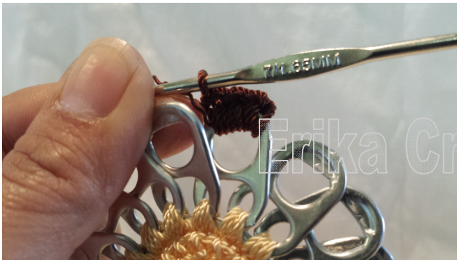
17. Single Crochet 4 in all pull tabs 17. 4 medios puntos en todas las anillas