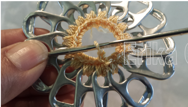
9. Chain 1 9. Subir con una cadena